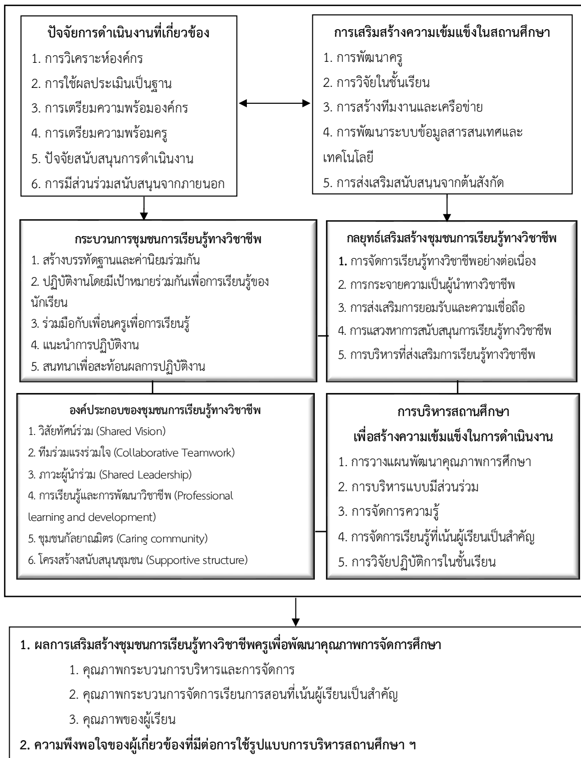
ภาพที่ 7 ร่างรูปแบบการบริหารสถานศึกษาในการเสริมสร้างชุมชนการเรียนรู้ทางวิชาชีพครู เพื่อพัฒนาคุณภาพการจัดการศึกษาของโรงเรียนสารวิทยา